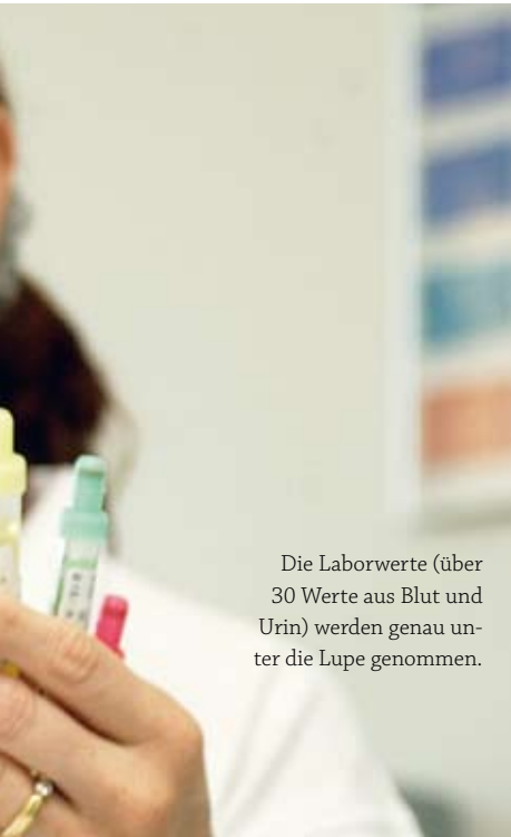
Die Laborwerte (über 30 Werte aus Blut und Urin) werden genau unter die Lupe genommen.